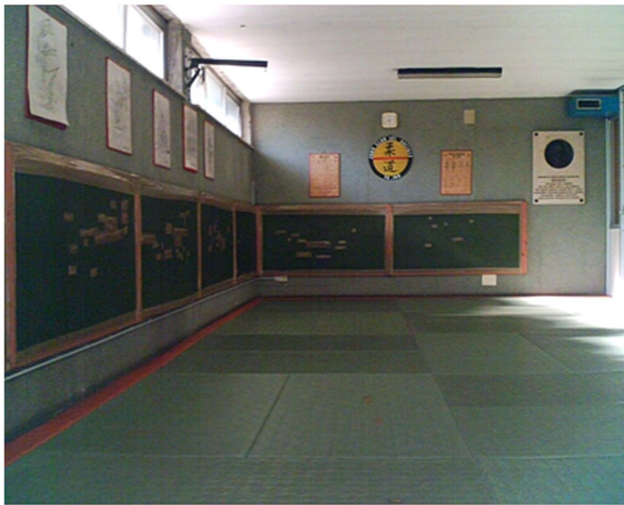
Il corso si svolge presso la palestra attrezzata con tatami del MAGIS SPORT Corso Siracusa 10 - Tel. 011.36.68.30

Sono naturalmente graditi i tuoi amici e parenti eventualmente interessati: fai passaparola!